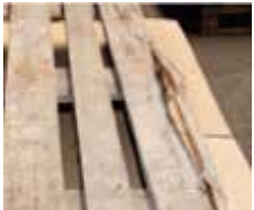
Priečne čiastočne alebo úplne zlomená doska