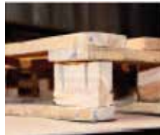
Viditeľné spojovacie prvky, napr. klince alebo skrutky