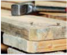
Zatlčenie vyčnievajúcich klinecov