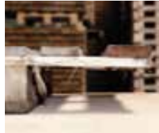
Chýba konštrukčný prvok