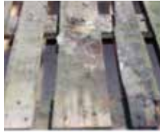
Vysušenie / vyčistenie