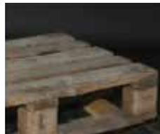
Bez predpísaného označenia - už nie sú viditeľné