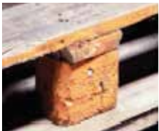
Znečistenie, ktoré by mohlo byť prenesené na náklad, napr. farba, olej, zápach, plesňové škvrny