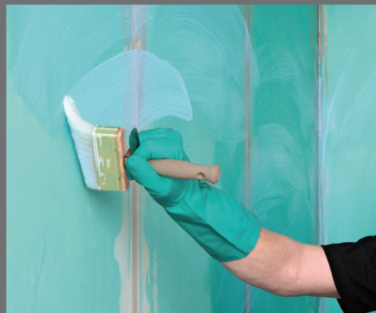
PCI Gisogrund® PGM – penetrácia podkladu

Špeciálna gumená kaširovaná manžeta na utesnenie prechodov rúrok.