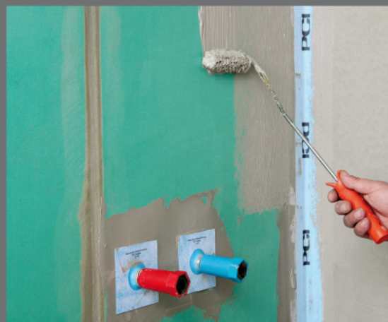
PCI Pecitape® 10x10 – izolácia prestupov PCI Pecitape® Objekt – izolácia kútov