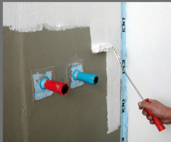
PCI Lastogum® – izolácia plôch