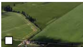
Plochy so zanedbateľnou vegetáciou a bez prekážok