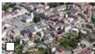
Plochy s priemernou výškou budov menej ako 15 m (obec, les)