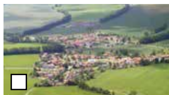
Plochy s nízkou vegetáciou a s čiastočným zastavaním