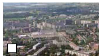
Plochy s priemernou výškou budov viac ako 15 m (mesto)