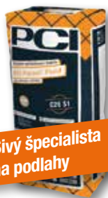
Sivý špecialista na podlahy